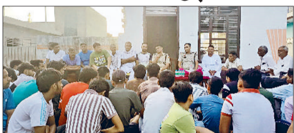
रेवाड़ी। ग्रामीणों व युवाओं को जागरूक करती पुलिस टीम तथा ग्रामीणों को जानकारी देते हुए पुलिस अधिकारी।