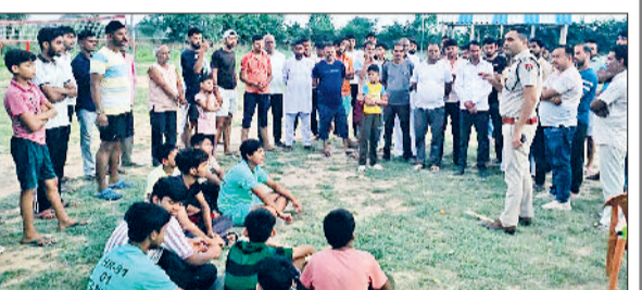
रेवाड़ी। ग्रामीणों व युवाओं को जागरूक करती पुलिस टीम तथा ग्रामीणों को जानकारी देते हुए पुलिस अधिकारी।

अभियान के तहत अब तक पुलिस की विभिन्न टीमों ने 100 से अधिक गांवों में जनसंवाद करके आमजन तक संदेश पहुंचाया है। पुलिस की सभी टीमों आमजन को स्वच्छता, पौधरोपण, महिला सुरक्षा, नशा मुक्ति जागरूकता तथा साइबर सुरक्षा की भी अहम जानकारी दे रही है।