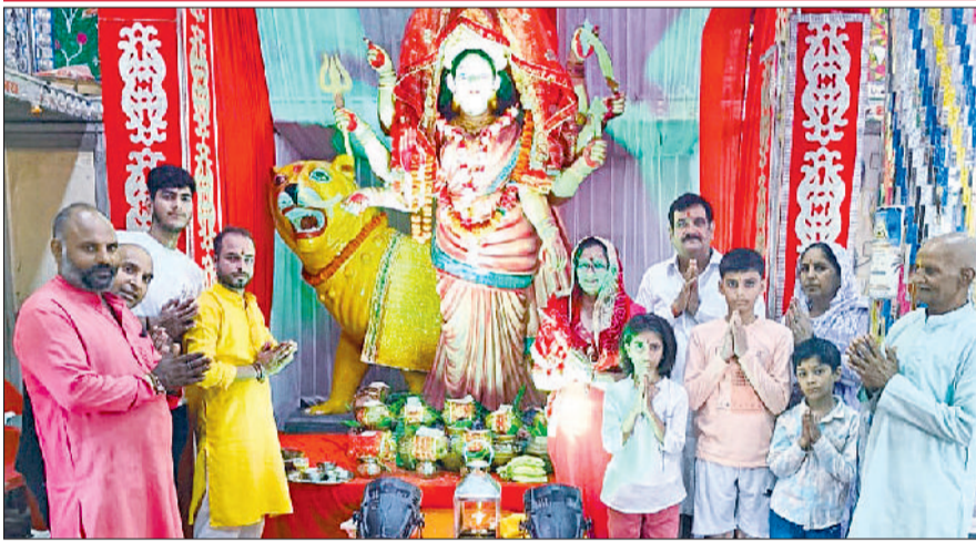
रेवाड़ी। सोलहराही धाम पर माता की पूजा करते श्रद्धालु।