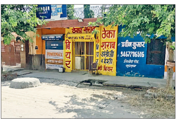
रेवाड़ी। सुधराना गांव में मंदिर व रिहायशी क्षेत्र के समीप स्थित शराब का ठेका।