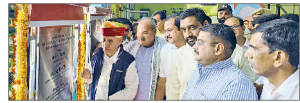
रेवाड़ी। विकास योजनाओं का उद्घाटन व शिलान्यास करते हुए राव इंद्रजीत सिंह।