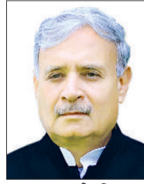
राव इन्द्रजीत सिंह।