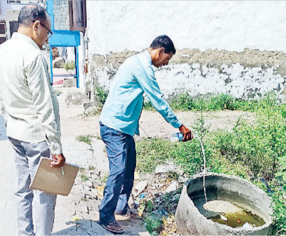
रेवाड़ी। पानी के बर्तन में दवाई डालते हुए स्वास्थ्य कर्मी।

▶▶ डेंगू पाँजिटिव केसों के आने से ब्लड बैंकों में प्लेटलेट्स की भी डिमांड बढ़ने लगी है। स्वास्थ्य विभाग की ओर से प्रतिदिन डेंगू व मलेरिया संभावित लोगों की स्लाइड तैयार की जा रही है।