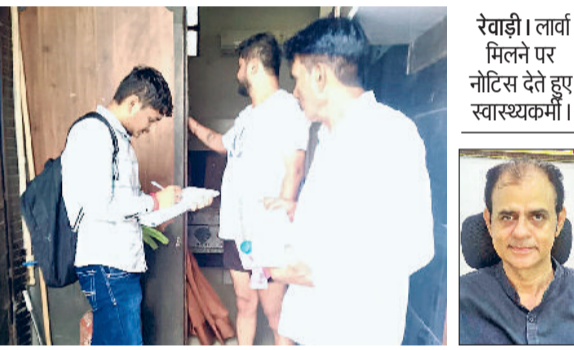
रेवाड़ी। लार्वा मिलने पर नोटिस देते हुए स्वास्थ्य कर्मी।